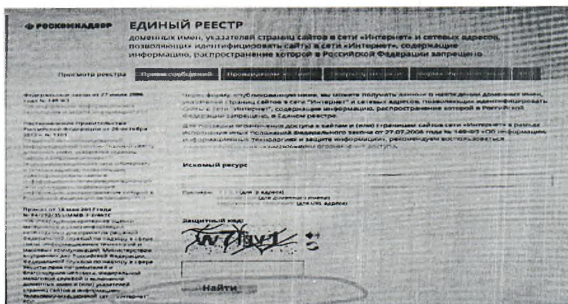
Рисунок № 3.

Проверяем вносились ли ранее сведения о найденном ресурсе в ЕАИС «Единый реестр» (рисунки № 3 и № 4):